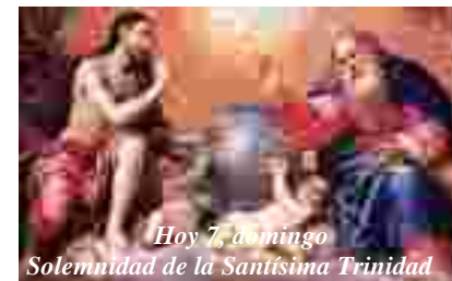
Hoy 7.º domingo Solemnidad de la Santísima Trinidad

PARROQUIA ASUNCIÓN DE NUESTRA SEÑORA. TORRELODONES